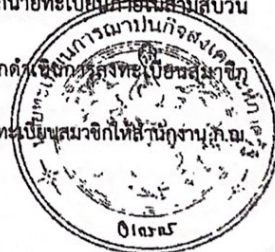
(นางสาวกรรณ ธีระวิภา) นักพัฒนาสังคมชำนาญการพิเศษ

ในกรณีที่มีการเปลี่ยนแปลงข้อมูลเกี่ยวกับสมาชิกตามที่ปรากฏในทะเบียนสมาชิกให้สำนักงาน ก.ณ. รายงานนายทะเบียนตามแบบที่นายทะเบียนกำหนดตามระยะเวลาในข้อ ๓๖