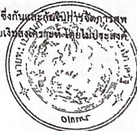
(นางอรารณ์ อ้าใจจิตต์) นักพัฒนาสังคมชำนาญการพิเศษ