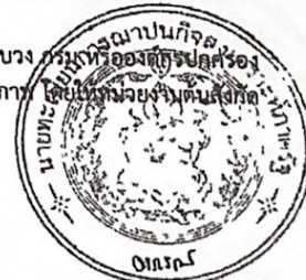
(นางอารณ์ อ้าโหจิตต์) นักพัฒนาสังคมชำนาญการพิเศษ

ข้อ ๑๔ สมาชิกซึ่งโอนหรือย้ายไปรับราชการในสังกัดกระทรวง ทบวง กรม หรือองค์กรปกครองส่วนท้องถิ่นอื่น หรือพ้นจากราชการ หรืองานด้วยเหตุใด ๆ ไม่ทำให้ขาดสมาชิกภาพ โดยไม่ต้องแจ้งให้สำนักงาน ก.ม. ทราบโดยเร็ว