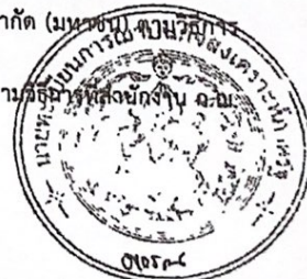
(นางอารมย์ อำไพจิตร) นักพัฒนาสังคมชำนาญการพิเศษ